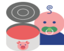
Консервы мясные для детского питания