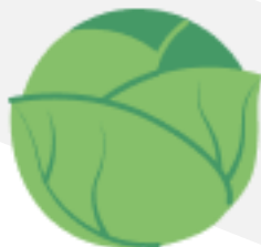
Капуста белокачанная свежая