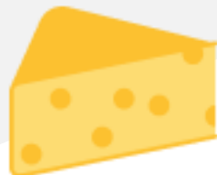
Сыры сычужные твёрдые и мягкие