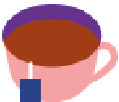
Чай чёрный байховый