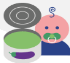
Консервы овощные для детского питания