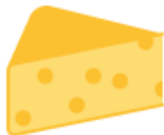
Сыры сычужные твёрдые и мягкие