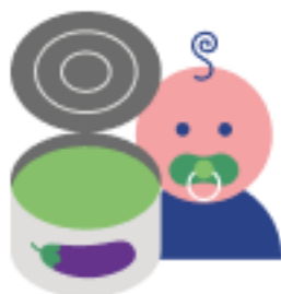
Консервы овощные для детского питания