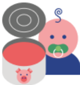
Консервы мясные для детского питания