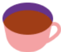
Чай чёрный байховый