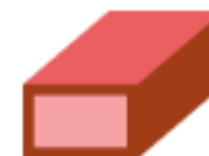
Конфеты мягкие, глазированные шоколадом