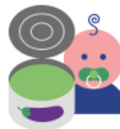
Консервы овощные для детского питания