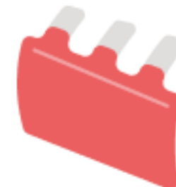
Свинина, кроме бескостного мяса