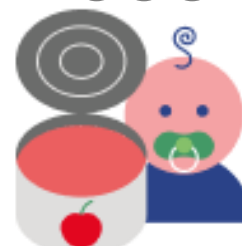
Консервы фруктово- ягодные для детского питания